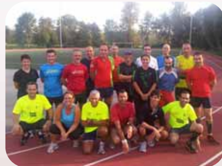
Union Athlétique des Couleurs p. 40